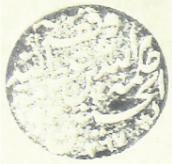
(على الفطرة أي على الإسلام)

المملكة العربية السعودية وزارة الشؤون الإسلامية والأوقاف والدعوة والإرشاد مكتبة الملك عبدالعزيز المدينة المنورة